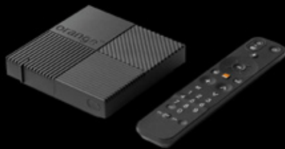
Orange TV Box 4K